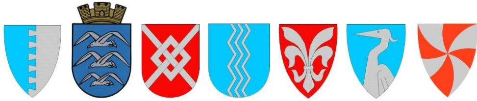
Etne Haugesund Karmøy Sauda Sveio Tysvær Vindafjord