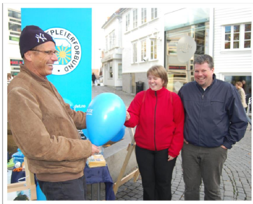
NSF profilering i Stavanger sentrum

Medlemsblad for Norsk Sykepleierforbund Rogaland Nr. 4 - desember 2009, 26. årgang